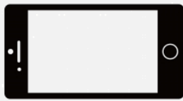
スマートフォンの場合