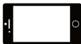
スマートフォンの場合