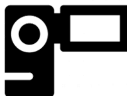
ビデオカメラの場合