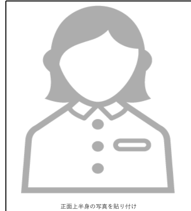
正面上半身の写真を貼り付け