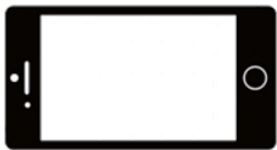
スマートフォンの場合

・撮影は、横長の画角(できれば16:9)になるようにおこなってください。縦長の画角は失格対象となりますので、スマートフォンを使用して撮影する場合には、特に注意をお願いいたします。