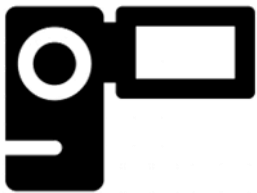
ビデオカメラの場合

・BGM・効果音は協会指定の楽曲またはYouTubeのオーディオライブラリーから後付けで使用してください。BGMを付けなくても構いません。